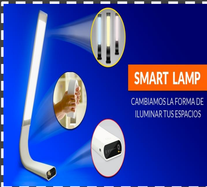
ON DESKTOP No strobe • No radiation